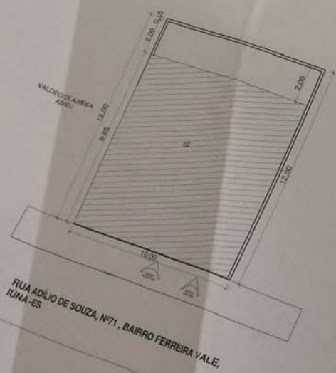
3 PLANTA DE SITUAÇÃO E LOCAÇÃO ESCALA 1:100