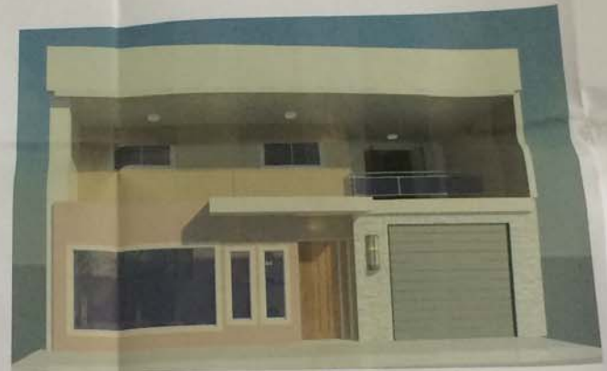
4 FACHADA-VISTA FRONTAL 1/50