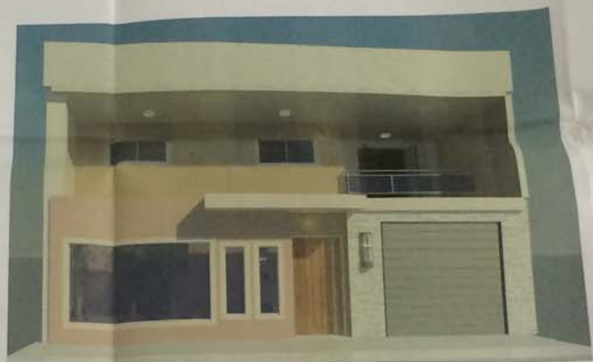
4 FACHADA - VISTA FRONTAL 1/50