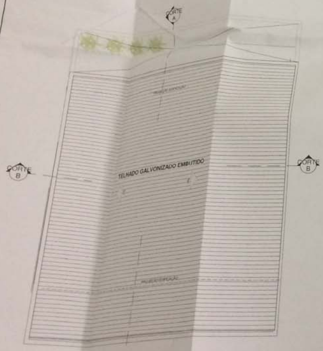
PLANTA DE COBERTURA ESCALA 1/50